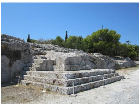
سکوی سخنرانی پنیکس، آتن

مشابه این امر می‌تواند در دانشگاه رخ دهد. شورای عمومی شکلی از تمرین این اخلاق سیاسی است. دانشجویان -اعضای یک صنف که بواسطه رابطه مادی مشترکی در کنار هم و در یک فضا(دانشگاه) قرار گرفته‌اند- با شرکت در شوراها، فاعلیت خود را تمرین خواهند کرد. دانشجویان از حالت منفرد خارج شده و در رابطه با کل قرار می‌گیرند. دیگر درد و رنج و دغدغه و مشکلاتش، فردی نیستند بلکه حالتی جمعی به خود خواهند گرفت. بنابراین شورای عمومی، گریزی به فاعلیت سیاسی دانشجویان است. مضاف اینکه شورای عمومی دانشجویان، مزیتی دارد که اکلسیاهای یونان نداشتند. در یونان آنچه فرد را در رابطه با کل قرار می‌داد، تماما سیاسی بود و به ندرت مربوط به مسائل اقتصادی می‌شد. بنابراین شهروند در این سیاسی‌شدن، خطر از دست‌دادن دقیقه تکنیکی‌اش را تجربه می‌کرد. اما در دانشگاه بواسطه زیست مشترک اقتصادی دانشجویان (علی‌الخصوص ساکنین خوابگاه)، پیوندی عمیق‌تر به واسطه مسائل صنفی-که خاستگاهی اقتصادی دارد- میان افراد شکل می‌گیرد و این امر به حفظ دقیقه تکنیکی در عین رفع آن کمک خواهد کرد و در نهایت منجر به ساخت کلی واقعی‌تر خواهد شد.