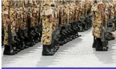
سپاه در تلاش برای تسخیر آموزش و پرورش؛

در «بخشنامه سرباز معلم» که در تاریخ ۹ خرداد به تصویب هیات دولت رسیده است، با اشاره به توافق دوجانبه بین سپاه پاسداران و وزارت آموزش و پرورش در تاریخ چهارم خرداد ماه؛ اولویت در جذب سرباز معلم‌ها به «بسیجیان فعال و بسیجیان دارای کارت تکمیلی» داده شده است. بخشنامه سرباز معلم و برنامه‌ریزی برای «جذب ۳۲۰۰ نیرو با «اولویت اعضای بسیج» امسال در حالی تصویب و منتشر شده که رویه حکومت در تشکیل پرونده و اعمال فشارهای امنیتی علیه فعالان صنفی با شدت بیشتری ادامه دارد و مطالبات معلمان نیز بی‌پاسخ مانده است.