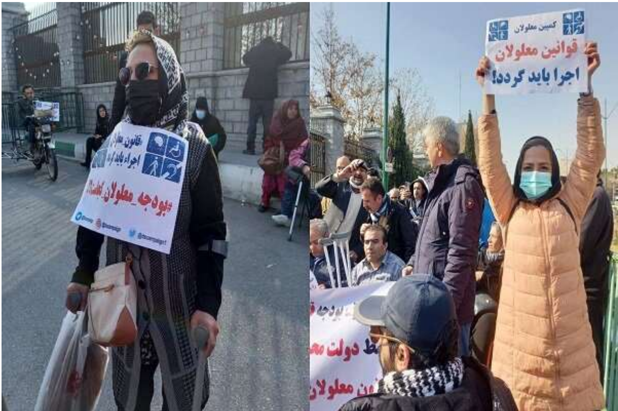
اعتراض گروهی از مردم به حذف بودجه مستقل «قانون حمایت از حقوق معلولان» در لایحه بودجه ۱۴۰۲ مقابل ساختمان مجلس

ردیف اعتباری مربوط به حقوق افراد دارای معلولیت در لایحه بودجه ۱۴۰۲ حذف و مبلغی به سرجمع به بودجه سازمان بهزیستی افزوده شده است.